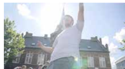
Musikvideoen "Ud i det blå" er afspillet 146.000 gange på Youtube.

Og det er OK at sige højt nogle gange: "Gud, hvor er det da hårdt at være ung!" Så et godt råd: Tal sammen om, hvordan I har det.