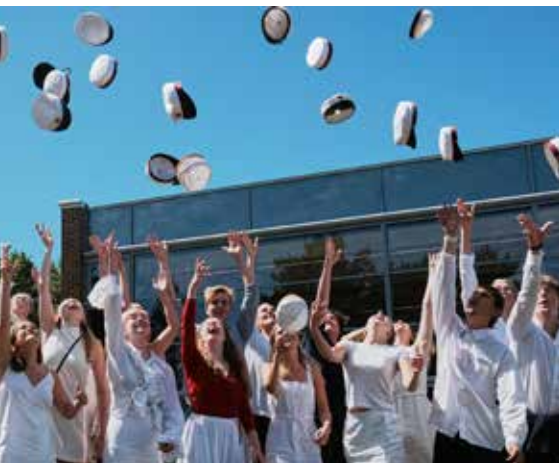
SG-studerer fejrer en veloverstået eksamen

Arrangementet afholdes hvert tredje år, således at alle elever har mulighed for at deltage én gang i deres gymnasietid. Etableringen og indretningen af studiecaféen er et eksempel på et elevforslag fra en tidligere temadag, der er blevet realiseret. Det samme gælder en række af de begivenheder, vi afholder, bl.a. SGympiaden, der er en aktivitetsdag for alle eleverne, og SGønfesten, som er vores egen musikfestival.