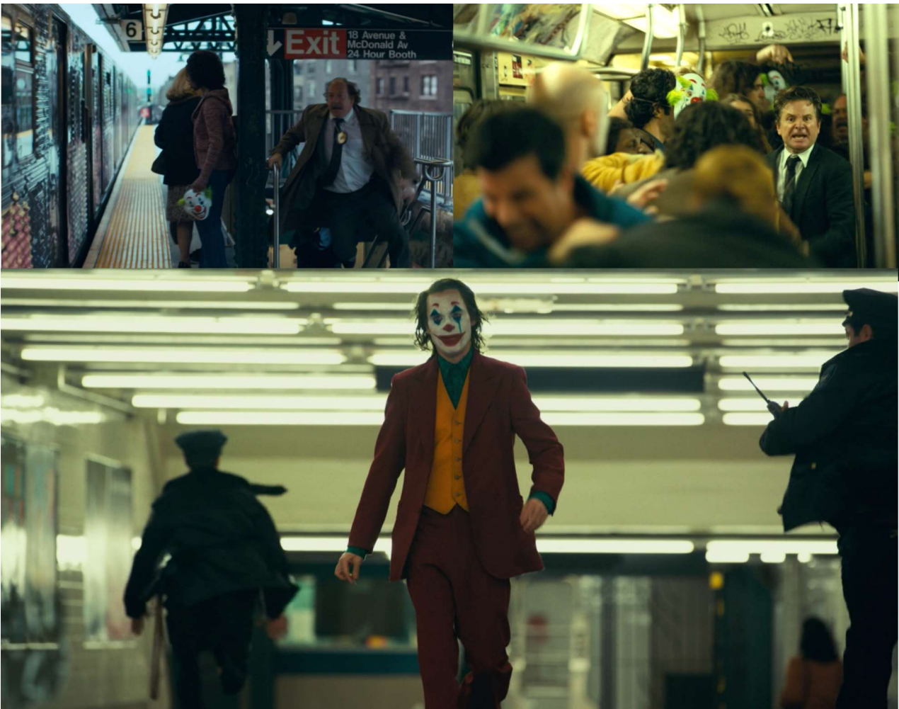
Figur 4: 01:32:37, 01:33:18, 01:34:33.

Det er således interessant, hvordan farverne bruges i sammenspil med hinanden. Eksempelvis, når politimændene jagter ham og scenen er blålig, lige indtil de træder ind i en metro overfyldt med rebeller, der alle støtter Arthur, og scenen bliver gul; da Arthur har magten her.