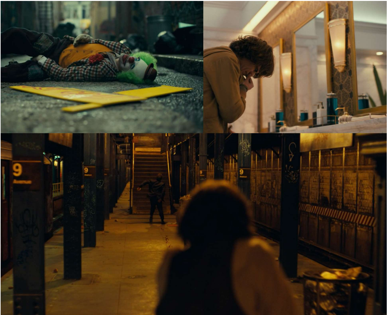
Figur 3: 00:03:26, 01:27:08, 00:33:42.

De gullige toner forekommer i situationer hvor Arthur er nedtrykt, mister kontrollen eller udviser styrke. På den måde bliver den gule farve et symbol på hans mørke side, der udfoldes i løbet af filmen. Arthur er iført gul for at fremhæve situationer, hvor han har det svært; når drengene stjæler hans skilt, når han er til terapi ved psykologen, når Wayne afviser ham, når han finder ud af, at han er adopteret og når han bliver fyret fra sit arbejde. Omvendt bruges den samtidig til at fremhæve hans styrke, eksempelvis da han skyder og dræber de tre forretningsmænd i undergrunden. På trods af, at det foregår om natten, er scenen domineret af klare gule toner, der indikerer, at Arthur på en og samme tid mister kontrollen og er ved at genvinde magten.