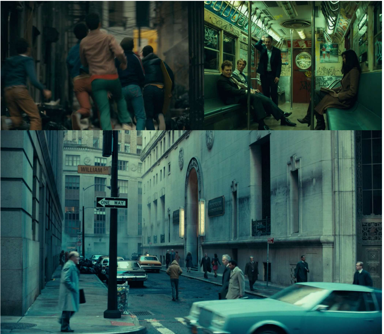
Figur 1: 00:02:43, 00:30:14, 00:24:46.

Blå fremtræder i alle de scener, hvor Arthur møder modstand – og bruges til at fremkalde følelser af trist -og tomhed. Vi overvældes af blålige toner fra filmens første indstilling, når en flok teenagere, alle klædt i blå, stjæler hans skilt og banker ham i en baggård. Vi får en fornemmelse af, at vi befinder os i et kynisk samfund. Herefter er alle indstillinger, der skildrer udendørsscener i Gotham City præget af blålige toner, hvilket understøtter distancen mellem Arthur og samfundet. Endvidere er alle de personer, der træder på ham skildret iført blå tøj: Teenagerne bag overfaldet, den sure dame i bussen, de tre forretningsmænd i metroen, kollegaen, der forårsager, at han mister sit job, Murry Franklin og Thomas Wayne.