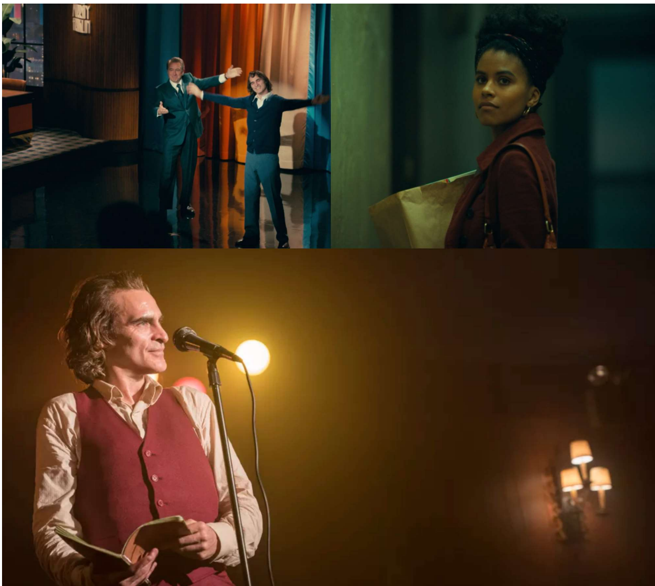
Figur 2: 00:14:44, 00:20:42, 00:44:46.

I modsætningen hertil fremtræder rød, når Arthur oplever fremgang. Rød, der dog sjældent dominerer scenerne, symboliserer kærlighed og selvtillid. Oftest fremtræder de rødlige nuancer i Arthurs drømmesekvenser, som når han forestiller sig, at Murry udtrykker et ønske om at få en søn som Arthur, eller når han forestiller sig, at publikum er vilde med hans optræden som komiker til open-mic aften på en klub. Iklædt rødt ses endvidere Arthurs nabo, Sophie, som han er i et imaginært forhold med, samt ham selv, når han over sig til Murrays show og da han optræder som komiker for første gang. Hans røde påklædning bruges til at fremhæve den selvtillid der opstår, når han møder anerkendelse fra omverdenen.